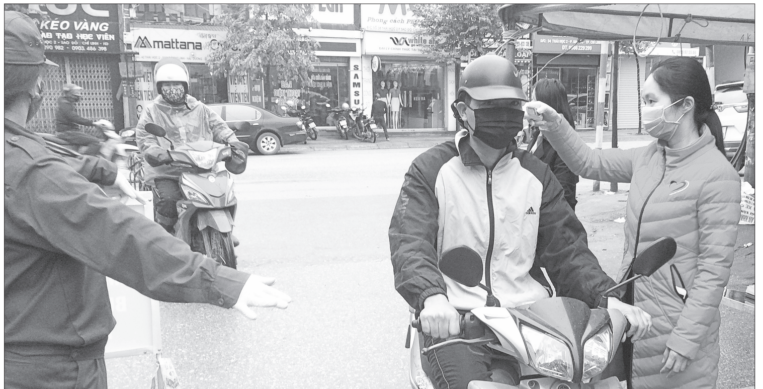
Nhân viên y tế của TP Chí Linh đo thân nhiệt cho người dân tại các chốt kiểm dịch