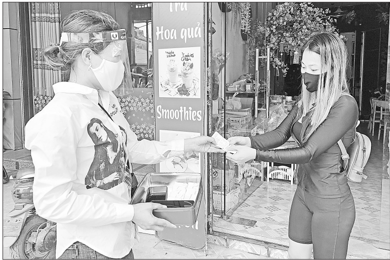
Nhân viên tổ thu ghi bảo đảm các điều kiện phòng dịch khi giao tiếp với khách hàng

TRƯỚC những diễn biến phức tạp của dịch Covid-19, Công ty CP Kinh doanh nước sạch Hải Dương đã tích cực triển khai nhiều biện pháp vừa chống dịch, vừa bảo đảm cung cấp nguồn nước sạch cho khách hàng.