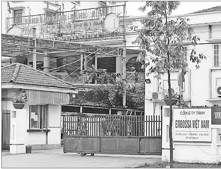
Đã thông báo ngừng hoạt động trong 6 tháng nhưng Công ty TNHH Embossa Việt Nam (TP Hải Dương) cho biết khi khôi phục sản xuất sẽ nhận lại người lao động và bảo đảm giữ nguyên mức lương

Ngoài ra, nhiều DN cho số đông công nhân, lao động nghỉ việc khoảng nửa tháng trong thời điểm thực hiện giãn cách xã hội như Công ty TNHH May mặc Makalot Việt Nam (hơn 5.000 người), Công ty CP May Hải Anh (gần 3.000 người), Công ty TNHH May Mayfair (hơn 800 người). Tất cả những công ty