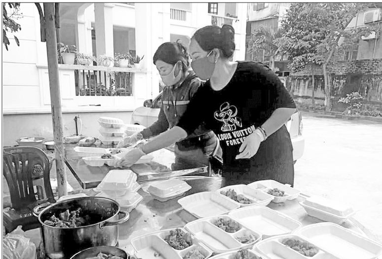
Người dân TP Chí Linh nấu các suất cơm miễn phí cho lực lượng tham gia trực chốt kiểm dịch