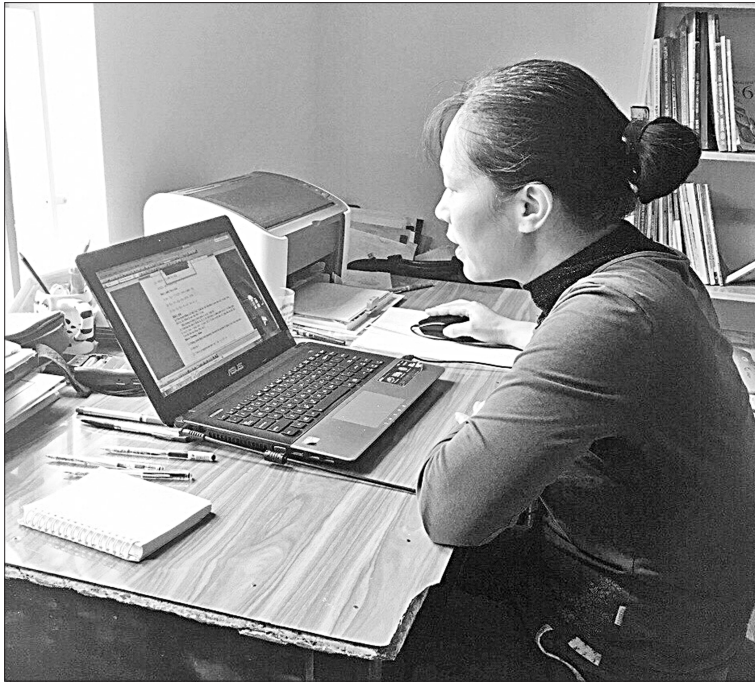
Nhân viên các cơ quan, đơn vị làm việc từ xa khiến nhu cầu sử dụng laptop tăng cao