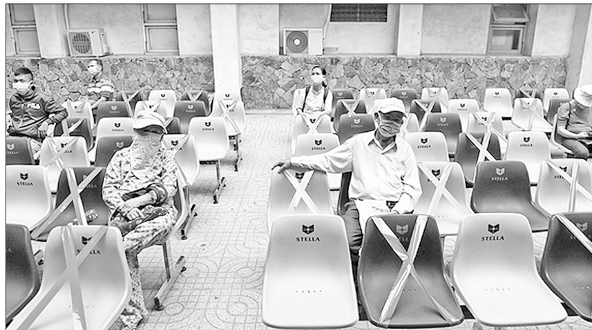
Bệnh viện Thống Nhất (TP Hồ Chí Minh) căng dây các ghế ngồi để giữ khoảng cách an toàn giữa các bệnh nhân

Sau ngày 15.4, Ban Chỉ đạo đề nghị Thủ tướng xem xét cho ban hành chỉ thị mới, trong đó xem xét việc thực hiện theo tình hình