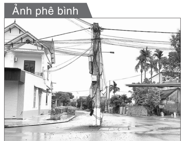
Hiện ngang... cột điện giữa đường. Ảnh chụp ngày 13.4 tại thôn 3, xã Thanh Xá (Thanh Hà)

Kính mời các nhà thầu có đủ năng lực, kinh nghiệm quan tâm tham gia.