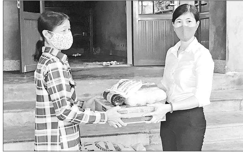
Hội Phụ nữ phường Minh Tân trao quà cho phụ nữ có hoàn cảnh khó khăn